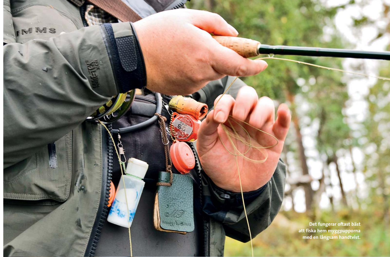
Det fungerar oftast bäst att fiska hem myggpupporna med en långsam handvrist.

Den främsta anledningen till att fisken präglas på att äta fjädermygg under hösten beror i första hand på att utbudet av föda är begränsat vid denna årstid.