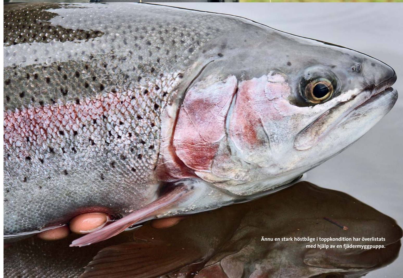
Ännu en stark höstbåge i toppkondition har överlistats med hjälp av en fjädermyggpuppa.