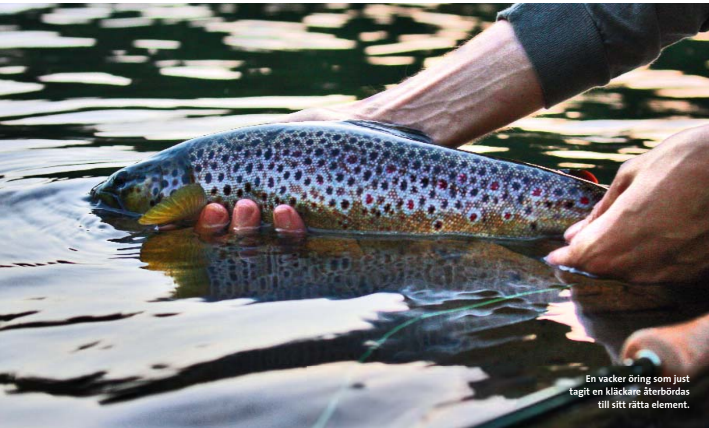
En vacker öring som just tagit en kläckare återbördas till sitt rätta element.

F iskens vaktstads styrs i första hand av de insekter som förekommer på och i vattenytan. Det är främst två insekter vi flugfiskare förknippar med vakande fisk, nämligen natt- och dagsländor. Lite förenklat kan man säga att dagsländorna dominerar säsongens första hälft varefter nattsländorna tar över efter hand.