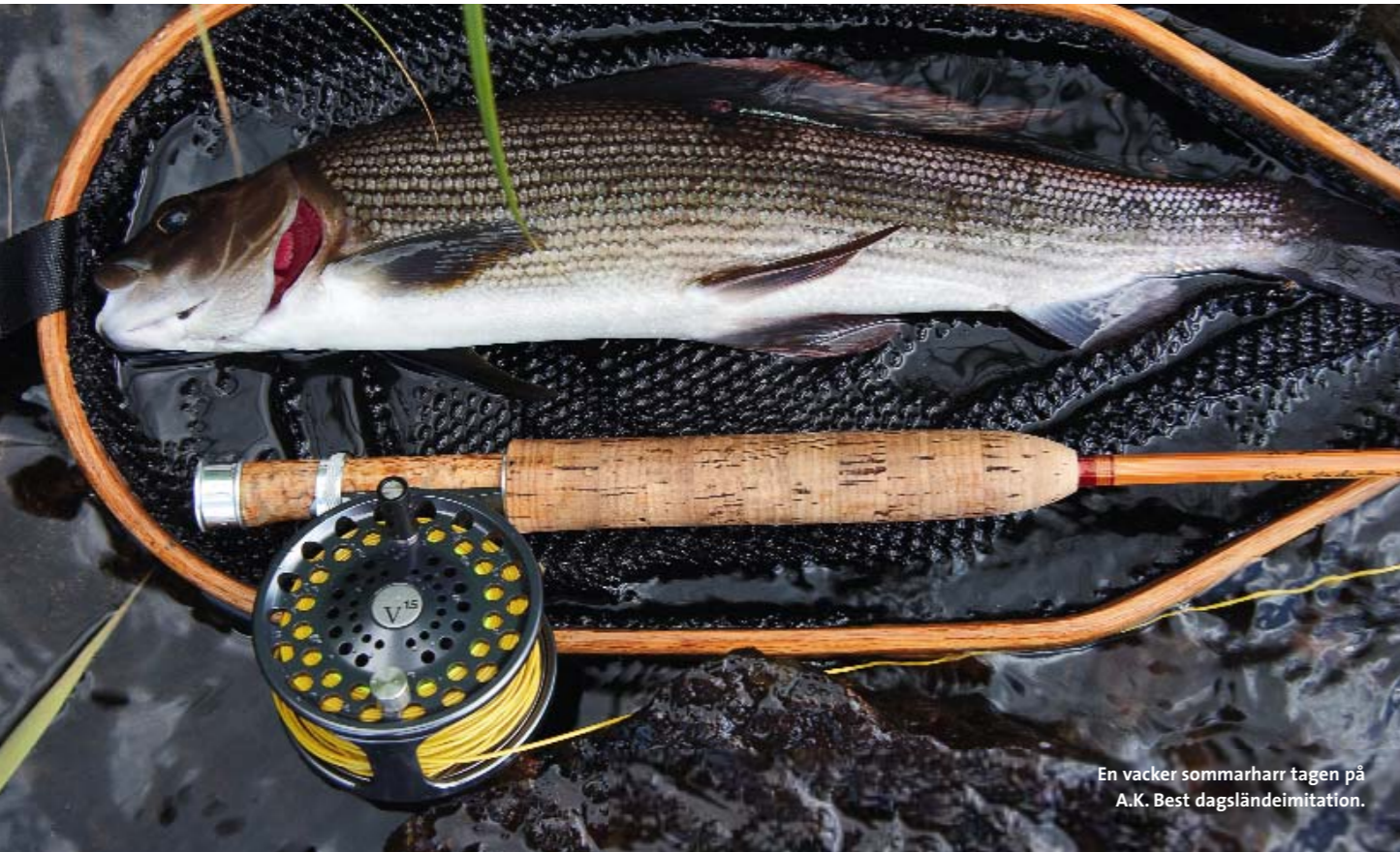
En vacker sommarharr tagen på A.K. Best dagsländeimitation.

FOAMKLÄCKAREN. Jag glömmmer aldrig ett besök vid norska Glomma för många år sedan. Varje kväll ställde harren upp sig på forsacken och vakade frenetiskt. Med så mycket vakande fisk borde naturligtvis också fisket ha varit bra, men trots ihärdigt kastande och idoga flugbyten i jakt på den rätta imitationen, uteblev ändå fiskelyckan. Först ett par kvällar senare stod det klart att fisken åt kläckande nattsländepuppor.